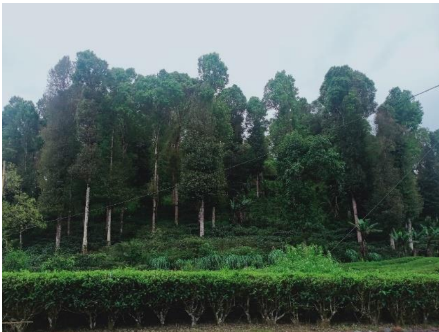
Gambar (Figure) 2. Salah satu kombinasi kayu-kopi yang berbatasan dengan perkebunan teh di Desa Indragiri, Kecamatan Rancabali (One of the coffee tree combinations bordering the tea plantation in Indragiri Village, Rancabali Sub-district)

lempung, napal gamping dan tufa vulkanik menengah (sitosol) dengan tanah gembur, tekstur tanah liat, struktur tanah rapuh hingga menggumpal, dan tanah dengan sensitivitas erosi sedang hingga tinggi. Iklim kawasan hutan menurut klasifikasi Schmidt dan Ferguson termasuk dalam tipe iklim A dan B dengan kisaran suhu udara 22 o C – 33 o C, dan curah hujan rata-rata 1.500 – 5.200 mm/tahun (Perum Perhutani, 2022). Berdasarkan karakteristik wilayah di atas, maka kawasan hutan produksi KPH Bandung Selatan yang secara administratif meliputi Kecamatan Rancabali dan Kecamatan Pasirjambu cocok untuk pengembangan budidaya kopi dengan pola agroforestri. Di wilayah ini juga terdapat peternakan sapi (Kresna et al., 2024), serta perkebunan teh (Gambar 2) dan pabrik teh yang dikelola oleh PT Perkebunan Nusantara (PTPN).