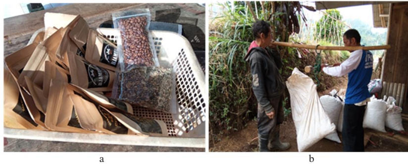
Gambar (Figure) 4. (a) Produk olahan kopi di LMDH Kanaan Hijau Desa Indragiri ( Processed coffee products in LMDH Kanaan Hijau, Indragiri Village ); (b) Petani yang menjual kopi kepada ketua LMDH Tenjolaya Desa Tenjolaya beserta hasil panen yang sedang ditimbang ( A farmer sells coffee to the head of LMDH Tenjolaya, Tenjolaya Village )