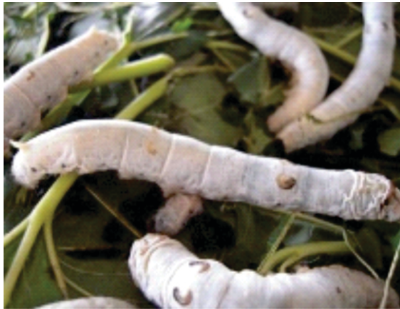
Hibrid P3H 2

Pada Tabel 6 terlihat bahwa keempat hibrid hasil Pusat Litbang Hutan yang dibudidayakan di dataran rendah Kabupaten Pati menghasilkan rasio kulit kokon yang sama baiknya, tetapi terhadap hibrid C301 (dari Perum Perhutani PPUS Candiroti) berbeda signifikan dan rasio kulit kokonnya jauh lebih tinggi daripada hibrid C301. Jika dikembangkan di dataran tinggi, maka hibrid P3H-2 dan P3H-3 menghasilkan rasio kulit kokon terbaik dan berbeda signifikan dengan hibrid P3H-1, P3H-4 dan C301. Jika dibudidayakan di dataran rendah dan dataran tinggi, maka hibrid P3H-2 menghasilkan rasio kulit kokon yang tertinggi.