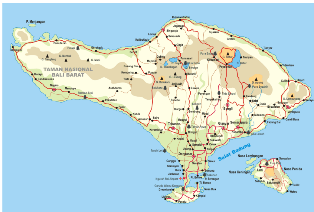
Gambar (Figure) 1. Peta lokasi penelitian ditunjukkan panah berwarna hijau ( Map of the research location indicated by the green arrow )

Fase fenologi paku dipengaruhi oleh faktor ekstrinsik dan intrinsik. Tidak banyak informasi mengenai pengaruh faktor intrinsik sementara faktor ekstrinsik sebagian besar berupa iklim (Mehlreter, 2008). Fenologi paku dilaporkan dari beragam daerah dengan iklim yang berbeda. Di Taiwan bagian utara, dimana tidak terdapat perbedaan musim kemarau yang jelas, daun yang muncul tidak berkorelasi dengan suhu dan curah hujan. Sementara tahapan fenologi yang lain seperti daun berkembang, daun layu, spora matang dan lepas memiliki korelasi positif yang signifikan dengan suhu ((Lee et al. , 2009).