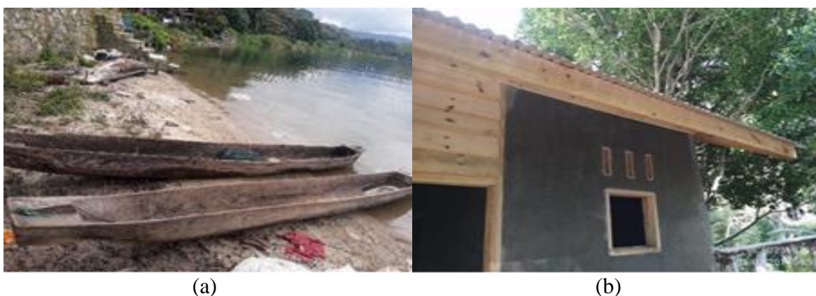
Gambar (Figure) 2. (a) Masyarakat desa memanfaatkan kayu suren menjadi (a) perahu, dan (b) bahan bangunan. ( Villagers used trunk of suren (a) for boats, and (b) for building materials )

Hasil penelitian menunjukkan bahwa nilai Net Present Value (NPV) terbesar pada Discount factor (df) 17,5% dengan nilai Rp 2.451.064/ha/daur yang terkecil nilai NPV sebesar Rp 194.860/ha/daur (daur tebang 15 tahun) dan nilai total NPV sebesar Rp 29.153.089 (Lampiran 1.).