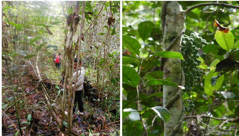
Gambar (Figure) 2. Kondisi tempat tumbuh habitus F. tinctoria berbuah di lokasi penelitian (The habitat condition of F. tinctoria fruiting in the study site)