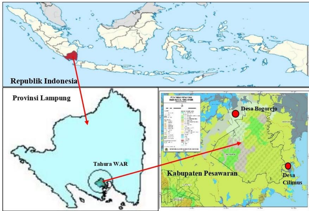
Gambar (Figure) 1. Peta lokasi penelitian, Tahura WAR dan dua desa di Kabupaten Pesawaran, Provinsi Lampung (● adalah desa penelitian: Bogorejo dan Cilimus) (Map of the research sites, WAR GFP and two villages in Pesawaran District, Lampung Province (● are research villages: Bogorejo and Cilimus))