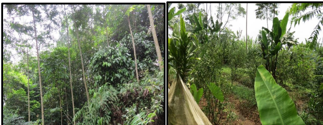
Gambar (Figure) 2. Pola tanam hutan rakyat luasan besar ( The cropping pattern in large-scale private forest )

Jenis tanaman berkayu (pohon) yang ditanam pada hutan rakyat pola 2, meliputi sengon ( P. falcataria ), kayu afrika ( M. eminii ), gmelina ( G. arborea ), jabon ( A. cadamba ), mindi ( M. azedarach ). Jarak tanam tanaman berkayu (pohon) yang digunakan adalah 3 m x 3 m. Jangka waktu panen untuk tanaman berkayu (pohon) sengon ( P. falcataria ), kayu afrika, gmelina ( G. Arborea ), jabon ( A. cadamba ), mindi ( M. azedarach ) selama 5-7 tahun. Jenis tanaman buah-buahan atau tanaman perkebunan yang ditanam pada hutan rakyat pola 2, meliputi pete ( P. speciosa ), duku ( L. domesticum ), rambutan ( N. lappaceum ), nangka ( A. heterophyllus ), jeruk ( Citrus spp), jambu ( P. guajava ). Jarak tanam tanaman perkebunan yang digunakan bervariasi antara 4 m x 5 m sampai 10 m x 10 m. Jangka waktu panen tanaman perkebunan, yaitu 1 tahun untuk jambu dan lebih dari umur 5 tahun untuk jenis lainnya.