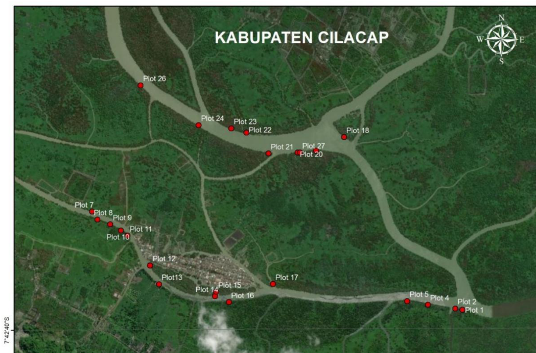
Gambar (Fig.) 1. Lokasi penelitian di Desa Motean dan Klaces Segara Anakan, Cilacap, Jawa Tengah (Research locations at Motean and Klaces village Segara Anakan, Cilacap, Central Java)

Penelitian dilakukan di kawasan pesisir Segara Anakan, Cilacap, Jawa Tengah, Indonesia yang masuk ke dalam wilayah Desa Motean dan Desa Klaces (Gambar 1). Lokasi penelitian merupakan wilayah Laguna Segara Anakan (SAL) Timur yang di dominasi oleh jenis A. marina . Terdapat 25 plot pengamatan yang dibuat untuk merepresentasikan kondisi A. marina di Segara Anakan (Gambar 1). Lokasi penelitian termasuk ke dalam zona ekosistem mangrove yang memiliki salinitas 6-10 ppm, fosfat 120,90-235,30 mg/kg dan nitrat 11,90-19,90 ppm dengan tekstur liat-liat berlempung (Hilmi et al., 2015). Secara geografis kawasan ini terletak pada 07° 40'36.1" LS dan 108° 50'57.5" BT.