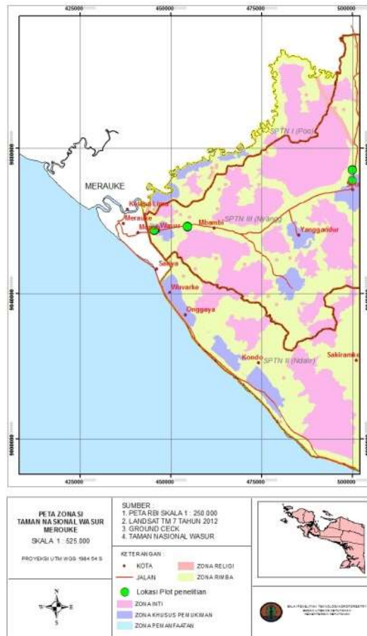
Gambar (Figure) 1. Lokasi plot penelitian hutan kayu putih di Taman Nasional Wasur, Papua ( Research Plot location of cajuput forest in Wasur National Park, Papua )

Casasola, Madero-Vega, Castillo-Campos, & Warner (2011), sedangkan analisis keanekaragaman hayati mengacu pada Magurran (2004). Indeks nilai penting (INP) tumbuhan digunakan untuk mengetahui tingkat dominasi jenis tumbuhan tertentu dalam komunitas dengan pendekatan kerapatan (K), kerapatan relatif (KR), frekwensi (F), frekwensi relatif (FR), dominansi (D), dan dominansi relatif (DR). Nilai INP merupakan penjumlahan KR+FR+DR, kecuali untuk tingkat pertumbuhan semai dan pancang, penghitungan INP hanya menjumlahkan KR dan FR. Sementara itu keanekaragaman hayati alpha diukur dengan indeks Shannon-Weaner dan indeks Simpson sedangkan indeks kekayaan jenis mengacu pada indeks