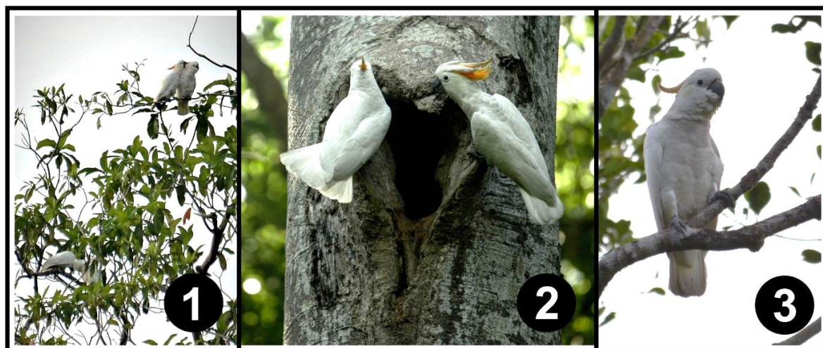
Gambar (Figure) 2. (1) Aktivitas bercumbu/saling menelisik di Pohon Halai ( Courtship activity/caressing at Halai Tree ); (2) Aktivitas beristirahat di Pohon Mara ( Rest activity at Mara Tree ); (3) Aktivitas makan di Pohon Kapuk Hutan ( Feeding activity at Kapuk Tree )