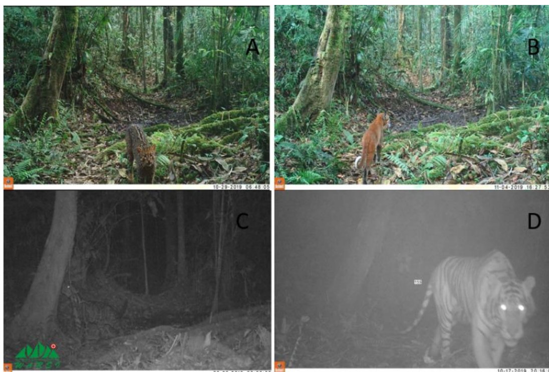
Gambar (Figure) 2. a) Pardofelis marmorata (marble cat/kucing batu), b) Catopuma temminckii (asiatic golden cat/kucing emas), c) Neofelis diardii (sunda clouded leopard/macan dahan), d) Panthera tigris sumatrae (sumatran tiger/harimau sumatera).

Ketersediaan satwa mangsa sangat berpengaruh terhadap keberadaan dan kelangsungan hidup satwa karnivora seperti harimau (Paiman, Anggraini, & Maijunita, 2018). Di Hutan Senamat Ulu, kelimpahan satwa mangsa tidak berbanding lurus dengan keberadaan satwa Harimau sumatera. Menurut Yanti (2011), keberadaan satwa mangsa akan berbanding lurus dengan keberadaan macan tutul, namun menurut Fata (2011) tidak selalu terdapat hubungan yang berbanding lurus antara perjumpaan harimau dengan keberadaan satwa mangsa. Kelimpahan macan dahan dan harimau Sumatra di kawasan hutan Senamat Ulu sangat rendah, hal itu bisa terjadi karena macan dahan berkompetisi dengan harimau Sumatra dalam memperoleh makanan (Sunarto, 2011).