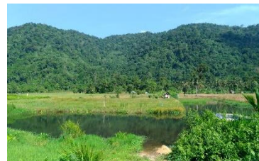
Gambar (Figure) 4. Potensi sumber daya air di sekitar TNGP ( Potential of water resources around GPNP )