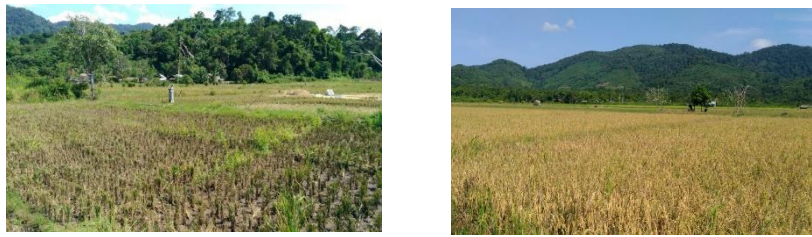
Gambar (Figure) 3. Kondisi lahan sawah di pinggiran kawasan TNGP ( Rice field condition on the periphery areas of GPNP )

Para petani dari empat dusun itulah yang memiliki lahan usaha tani yang cukup luas, sedangkan untuk para petani di Dusun Sei Belit, Melinsum, dan Tanjung Gunung cenderung bertani di lahan kering yang masih menerapkan praktek perladangan. Rendahnya produktivitas usaha tani di lahan kering masih menjadi permasalahan yang perlu diatasi melalui penerapan teknologi yang adaptif. Hal ini penting, karena ketahanan pangan tidak hanya ditentukan oleh akses terhadap sumber daya produktif, tetapi juga akses terhadap teknologi yang menimbulkan pemanfaatan sumber daya produktif tersebut (Mutea, Rist, & Jacobi, 2020). Sebagai respon terhadap hal ini, pemerintah pusat dan daerah telah berupaya menyediakan lahan di lokasi yang lebih subur berada di lembah dengan melakukan program pencetakan sawah untuk masyarakat lokal. Namun program ini tidak diikuti dengan pembinaan yang memadai secara terus menerus. Akibatnya, pemilikan lahan banyak beralih kepada kelompok masyarakat lainnya yang telah memiliki kemampuan bertani lebih baik. Fakta ini memperkuat temuan penelitian sebelumnya bahwa masalah akses lahan adalah sangat penting dalam menentukan ketahanan pangan, karena bagaimanapun ketahanan pangan rumah tangga di pedesaan banyak ditentukan oleh produksi dari usaha tani sendiri (Mulyo, Sugiyarto, & Widada, 2015).