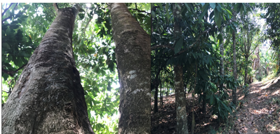
Gambar (Figure) 4. Pohon Indukan di Dusun Sansabik (kiri) dan Kondisi Budidaya Gaharu dengan campuran tanaman kakao (kanan) ( Mother trees in Sansabik Hamlet (left) and the condition of agarwood cultivation mixed with cocoa plants (right) ).

Gegelang dan Pemenang, masyarakat mempertahankan tanaman gaharu dengan rata-rata 20 pohon per pekarangan. Gaharu ditanam bersama tanaman lain seperti kakao, kelapa, durian, dan mangga. Sementara itu, di Dusun Sansabik terdapat pohon indukan gaharu berusia 60 tahun dengan diameter 58 cm dan 60 cm serta tinggi 18 m, yang dimanfaatkan untuk menghasilkan buah dan anakan.