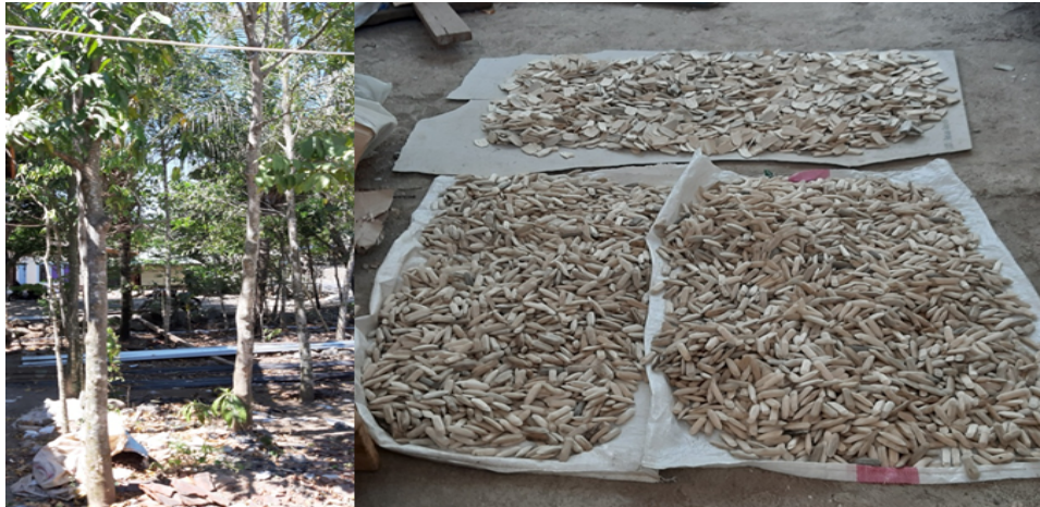
Gambar (Figure) 3. Kondisi perkebunan gaharu di Desa Orong (kiri) dan Bahan Baku BMW (kanan) ( The condition of agarwood plantations in Orong Village (left) and BMW Raw Material (right) )

Budidaya gaharu di Lombok Utara menunjukkan perbedaan mencolok antara Desa Senaru dengan Gegelang dan Pemenang. Di Senaru, Kecamatan Bayan, proyek pengembangan gaharu seluas 15 ha sejak tahun 2000 dengan 10.000 bibit bekerja sama dengan Universitas Mataram gagal berkembang. Pada 2019, hanya 20 pohon yang tersisa karena kelompok tani tidak aktif, dan petani beralih ke tanaman kopi dan mangga. Sebaliknya, di Desa