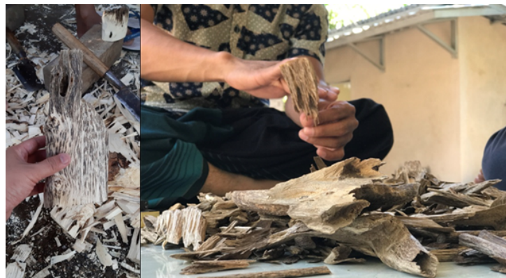
Gambar (Figure) 5. Proses carving dan produk carving siap jual ( The carving process and ready-to-sell carving products ).

bibit berukuran 1 m. Setelah itu, tanaman gaharu tidak memerlukan pupuk khusus dan dapat bertahan dalam kondisi ekstrem setelah tumbuh besar. Namun, pengeluaran terbesar terjadi saat inokulasi, dengan harga inokulan sekitar Rp800.000 per liter, atau sekitar Rp250.000 per batang jika menggunakan paku. Masa tunggu inokulasi atau paku sekitar 8 bulan sebelum hasil galih dapat dipanen. Selain itu, ada biaya carving gubal gaharu yang dihargai Rp150.000 per kg. Meskipun biaya awal untuk pengembangan tanaman gaharu relatif rendah, harga jual produk budidaya gaharu cukup tinggi, seperti kayu hidup dengan diameter 15 cm dan tinggi 7 m dihargai antara Rp300.000 hingga Rp600.000, atau cacahan kayu putih yang mencapai Rp4.000 per kilogram. Gubal kelas rendah yang banyak lubang dapat dijual dengan harga antara Rp500.000 hingga Rp2.000.000 per kg, sedangkan gubal kemedangan dihargai antara Rp1.000.000 hingga Rp3.000.000 per kg. Produk yang lebih bernilai tinggi seperti Black Magic Wood (BMW) dipatok dengan harga antara Rp300.000 hingga Rp1.000.000 per kg, sementara minyak gaharu dapat dijual seharga Rp150.000.000 per liter. Keuntungan yang besar ini menjadikan budidaya gaharu sebagai usaha yang menggiurkan meskipun memerlukan waktu dan usaha yang cukup besar.